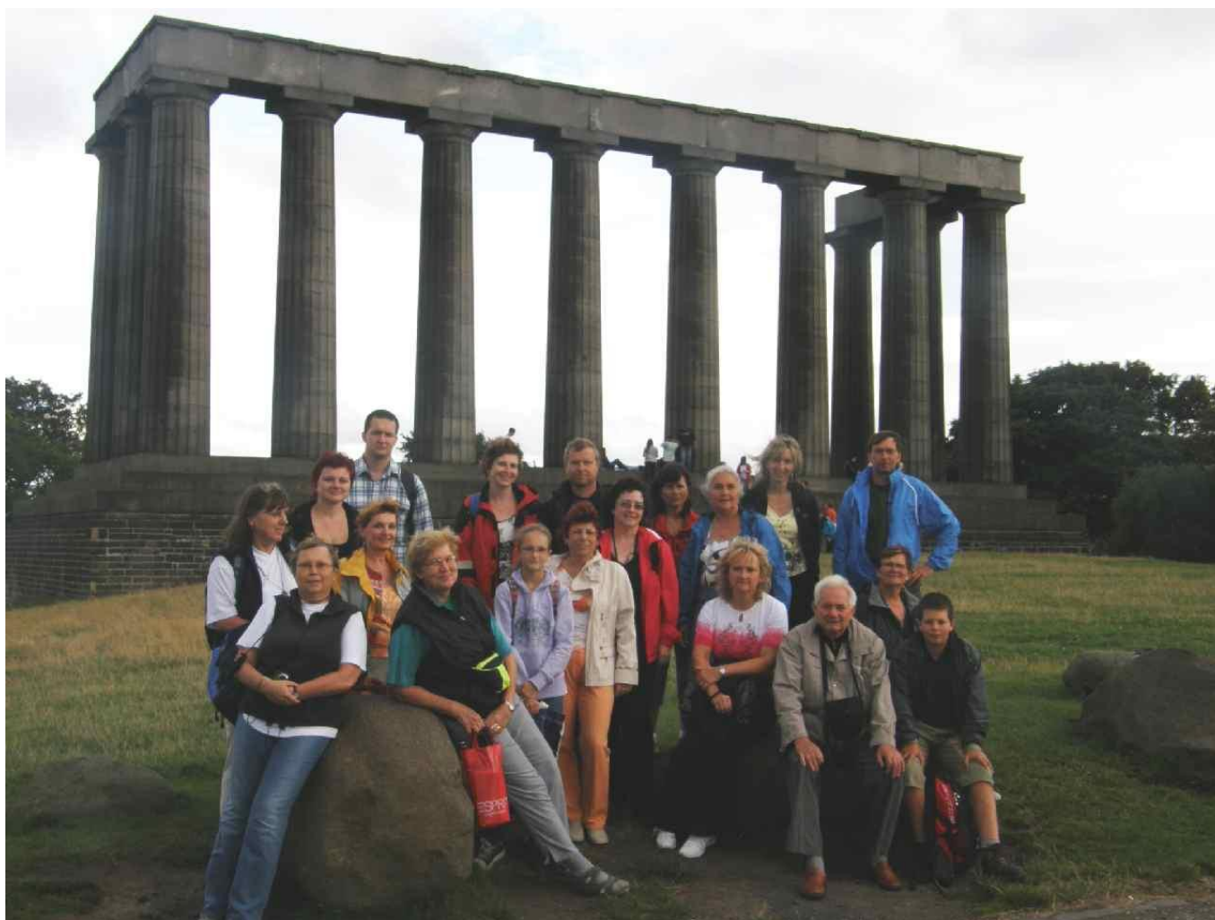
Skotsko - Více fotografií najdete na www.vodakh.cz