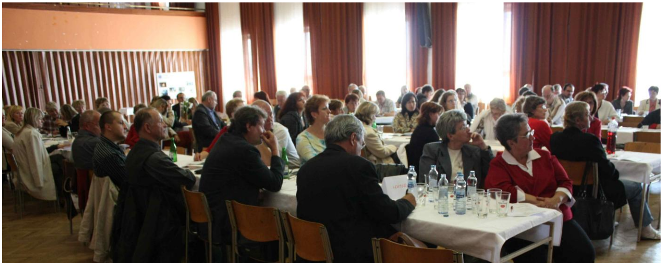
XXIV. setkání vodohospodářů

Redakční rada vede webovou stránku - letos již 3 087 návštěv (do 22/12), v roce 2005 - 1 315 návštěv, v roce 2006 - 1 418 návštěv, v roce 2007 - 2 295 a v roce 2008 - 2 604 a vydala jen 1 oblastní Zpravodaj (elektronický tj. pro více jak 92 % členů oblasti). Celkový rozsah příspěvků je 7,99 autorských archů, což je v přepočtu 160 (normalizovaných) stránek A4. Bohužel na příspěvcích se v roce 2009 podílelo pouze 7 autorů: Jan Lázňovský (68 %), Ing. E. Valterová (20 %), Ing. M. Perný (4 %), František Dyntera (3 %), Ing. P. Lázňovský (2 %), Petr Stránek (2 %) a Eva Pokorná (1 %). Kdo dále pomůže?