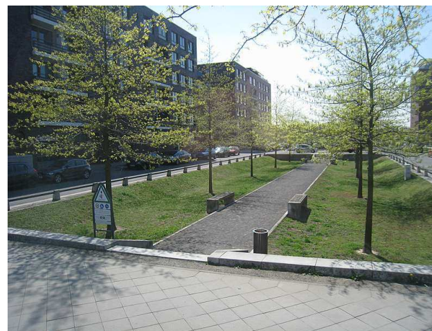
Zasakovací průlehy pro povrchové vsakování v Berlíně, SRN