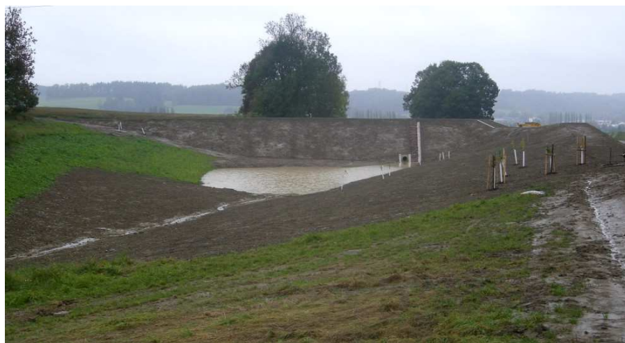
Poldr pod Borkem 2, Rychnov nad Kněžnou

Cílem je omezit riziko nepříznivých účinků spojených s povodněmi, zejména na lidské zdraví a na život, životní prostředí, kulturní dědictví, hospodářskou činnost a infrastrukturu